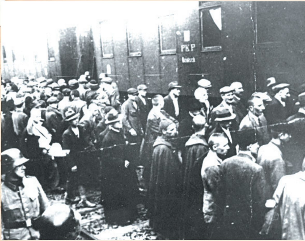
14 czerwca 1940 pierwszy transport do Auschwitz – wśród więźniów sanoczan

Więźniowie szybko przekonali się, czym jest oświęcimski obóz. Absolutnie niewystarczające jedzenie, praca ponad siły, bestialstwo SS-manów i więźniów funkcyjnych, egzekucje zbierały straszliwe żniwo. Nielatwo było przetrwać obozowe piekło, które pochłonęło ponad milion istnień ludzkich.