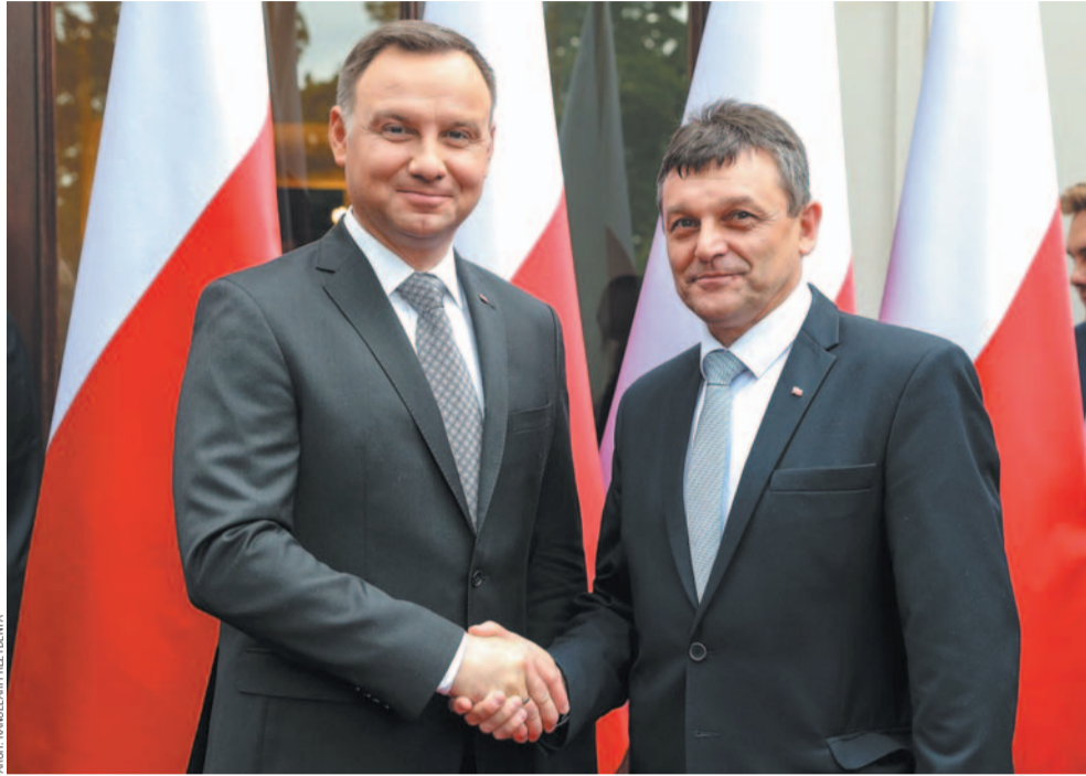
ARCH. KANCELARIA PREZYDENTA

„Trzeba mieć nie tylko powołanie do tej służby, ale trzeba mieć jeszcze odwagę. Wszyscy wiemy, że to jest bardzo poważne wyzwanie związane z wieloma trudnościami. Odtworzenie, odbudowanie samorządu terytorialnego to było oddanie istotnej części spraw publicznych, tych bliskich zwykłemu człowiekowi, w ręce społeczne. Tak się stało