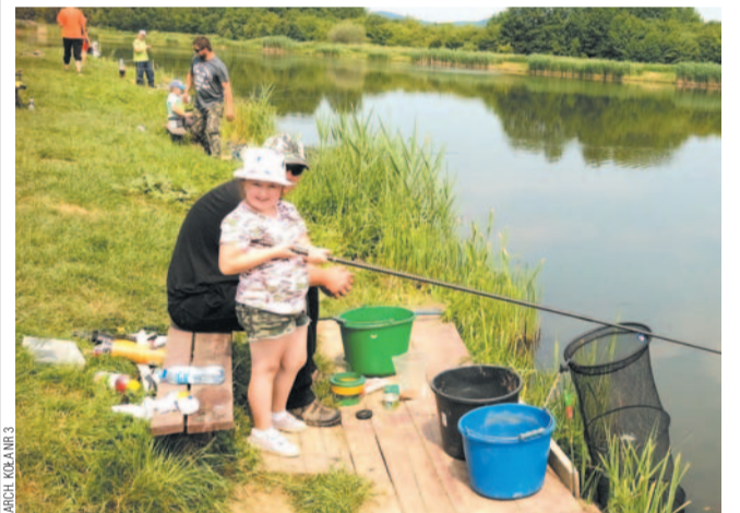
Zawody dzieci w „Sosenkach” okazały się bardzo udane

Większość kończyła łowienie z siatkami pełnymi ryb różnych gatunków. Nie zabrakło przerwy na poczęstunek, a na zakończenie wszyscy otrzymali wyróżnienia i nagrody niespodzianki. Radości i uśmiechom nie było końca.