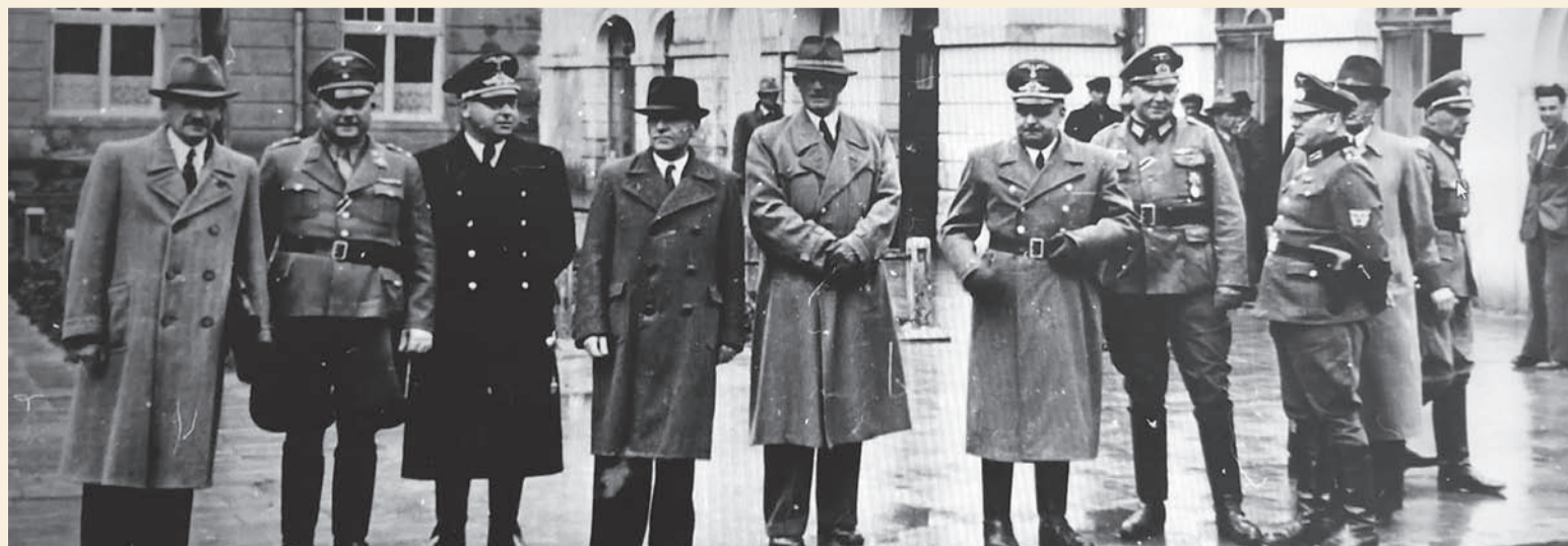
Przedstawiciele niemieckich władz okupacyjnych w Sanoku.