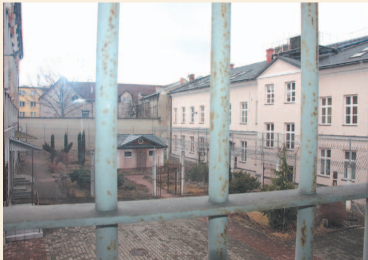
Dziedziniec więzienia w Sanoku, widok współczesny

W lipcu 1944 roku na ziemi sanockiej czuć było zbliżające się wyzwolenie spod okupacji niemieckiej. Front nieuchronnie zbliżał się do Sanoka. Hitlerowska machina terroru nie przestawała jednak pracować. Niemal do ostatniej chwili trwały aresztowania i egzekucje.