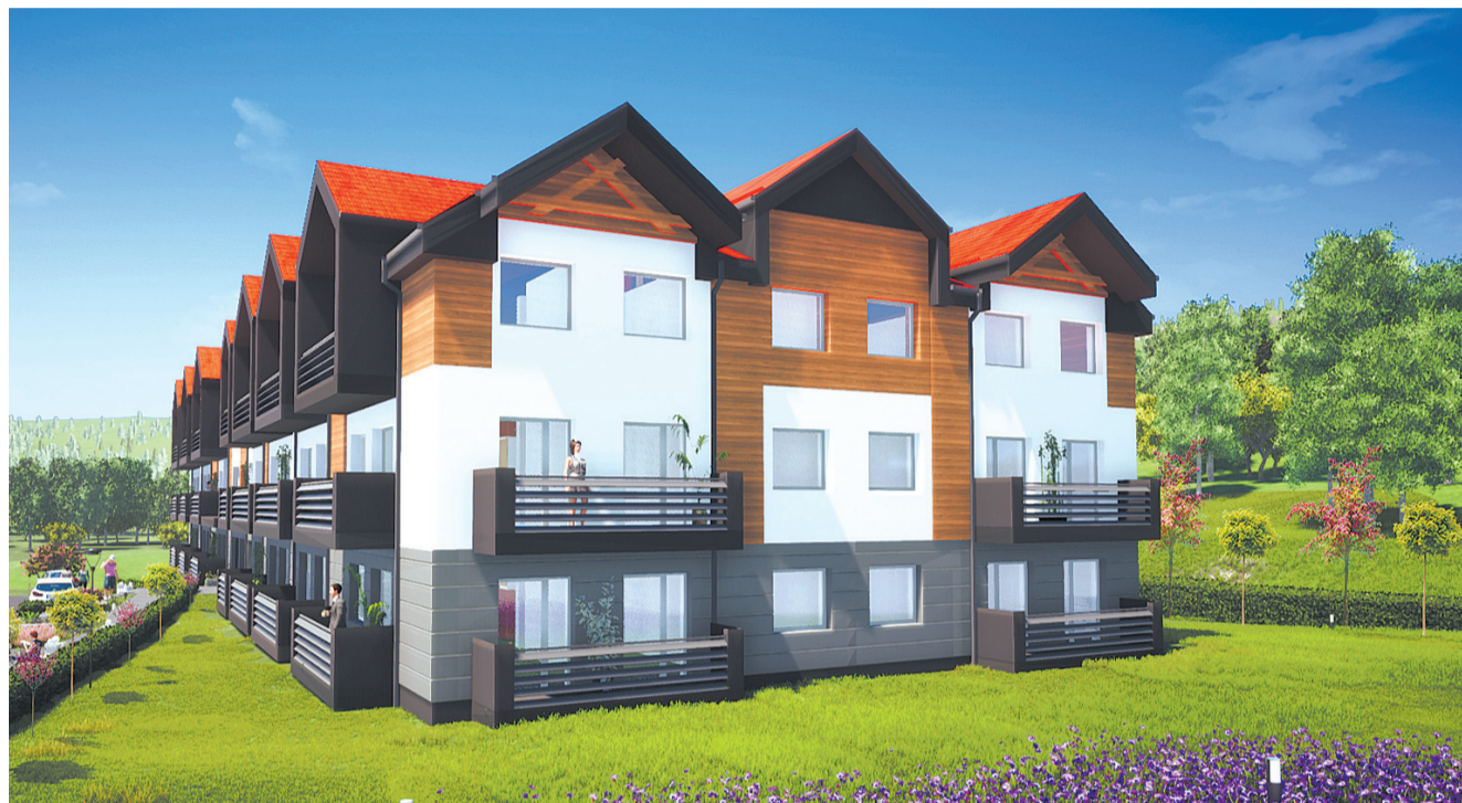
Wizualizacja bloków przy ul. Wyspiańskiego