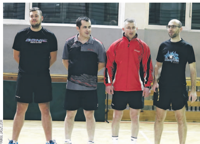
Druga drużyna SKT zakończyła sezon na 6. miejscu w tabeli IV Ligi