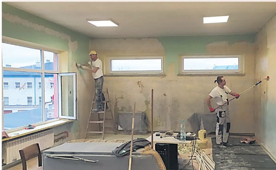
W trakcie remontu...

Warsztat Terapii Zajęciowej Stowarzyszenia „Świetlik” swoją siedzibę ma już od 2017 roku przy ul. Zielonej w Sanoku. Od tego czasu na bieżąco w budynku przeprowadzane są remonty, te na mniejszą skalę, ale też o większym znaczeniu. Ostatnie dwa lata to rozwój Stowarzyszenia, ale przede wszystkim poprawa warunków bytowych dla uczestników warsztatu. Obecnie WTZ „Świetlik” ma pod swoją opieką 45 podopiecznych, dla których często udział w warsztatach to okazja do poznania świata i odkrycia swoich pasji.