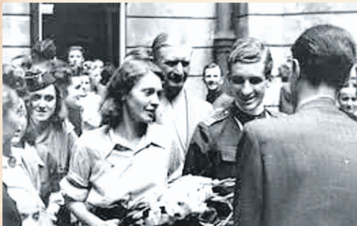
Ślub Bolesława Biegi w czasie Powstania Warszawskiego

Autor: jest wydawcą i redaktorem naczelnym czasopisma „Podkarpacka Historia” oraz portalu www.podkarpackahistoria.pl . Kontakt: redakcja@podkarpackahistoria.pl .