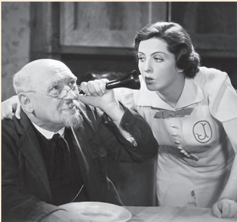
Józef Orwid w filmie Jadzia z gwiazdą-przedwojennego kina Jadwigą Smosarską

Sanocki ślad można odnaleźć także w szeroko opisanym i udokumentowanym na taśmie filmowej i zdjęciach wydarzeniu powstańczym, jakim był ślub Bolesława