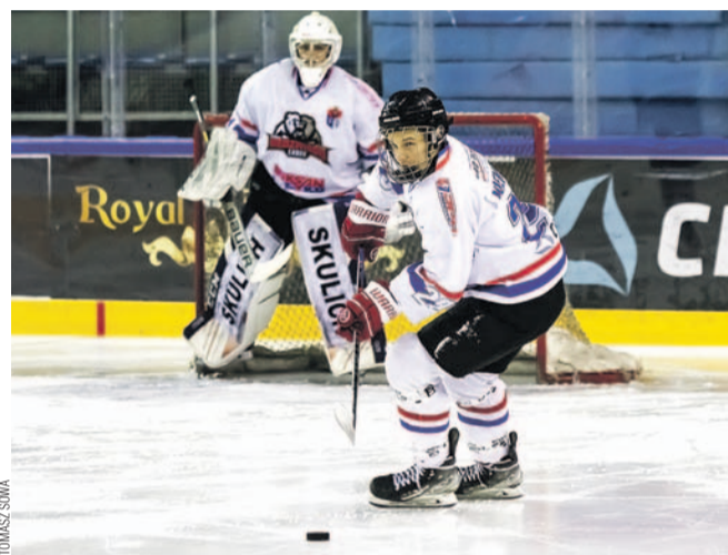
Tym razem Niedźwiadki musiały uznać wyższość rezerw Unii