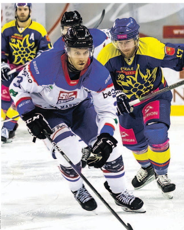
Podhale stawiało zacięty opór, ale punkty zostały w Sanoku

W piątek STS zagra u siebie z GKS-em Katowice, zaś w niedzielę z Unią Oświęcim. Początek obu pojedynków o godz. 18.