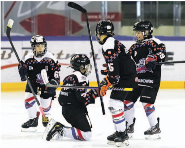
Zawodnicy Niedźwiadki uplasowali się tuż za podium

Po dwa najlepsze zespoły pozostały w grze o końcowe zwycięstwo, a reszta walczyła o 5. miejsce. Ostatecznie zajęła je drużyna z Slovakia Lions, w dalszej fazie turnieju wygrywając wszystkie trzy mecze. Niestety, smaku zwycięstwa nie zaznały już Niedźwiadki, porażkami kończąc półfinał z Revolution Hockey Team i mecz o 3. miejsce z Dnepr Dnipro, który wcześniej uległ ekipie HS Riga. W finale „Rewolucjoniści” nie dali żadnych szans Łotyżom, zwyciężając aż 15:1.