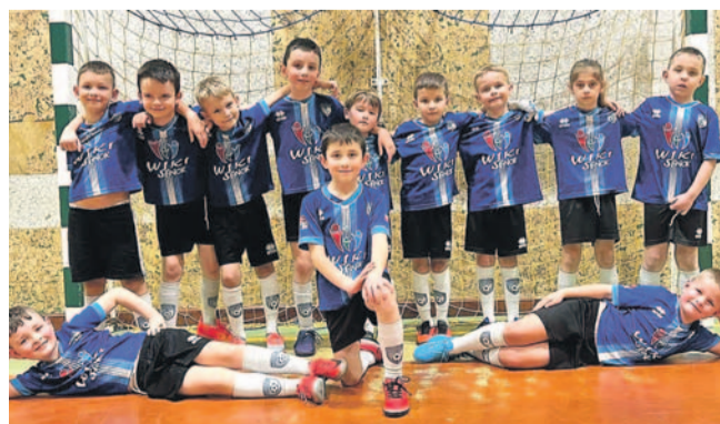
Drużyna AP wygrała rywalizację w Grupie Srebrnej

Podczas świątecznej przerwy grała tylko jedna drużyna – żacy młodsi Akademii Piłkarskiej, którzy pojechali na Turniej Bożonarodzeniowy w Brzozowie. Efektem było zwycięstwo w Grupie Srebrnej.